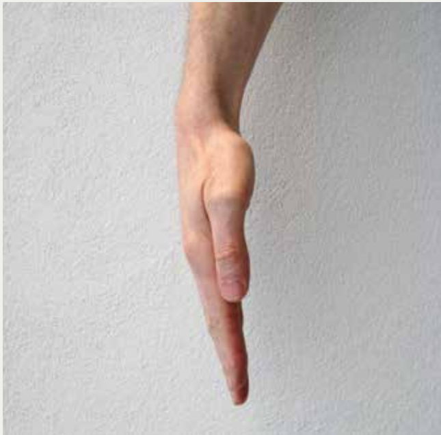
Hånd i neutral stilling