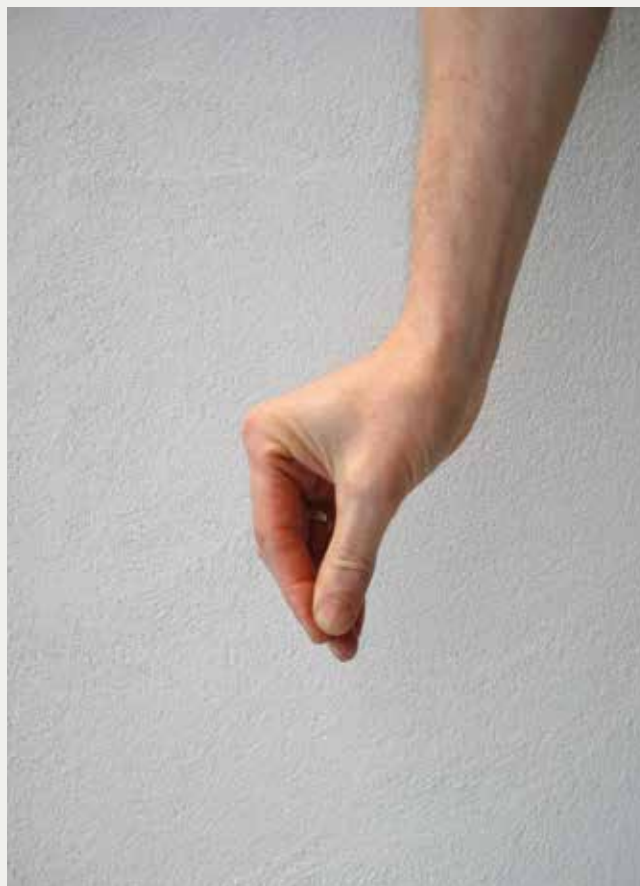
Hånd med pincetgreb