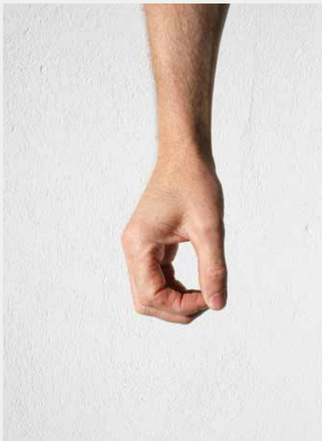
Hånd med kraftgreb