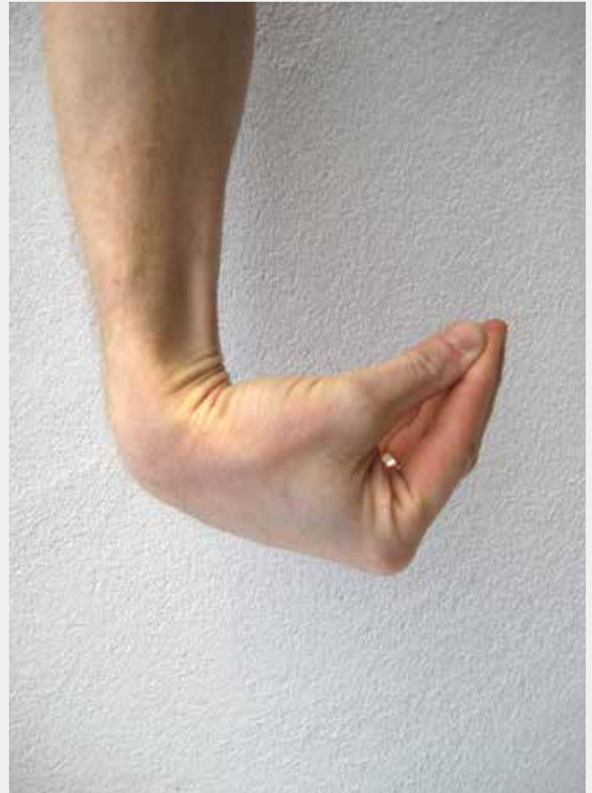
Hånd i yderstilling